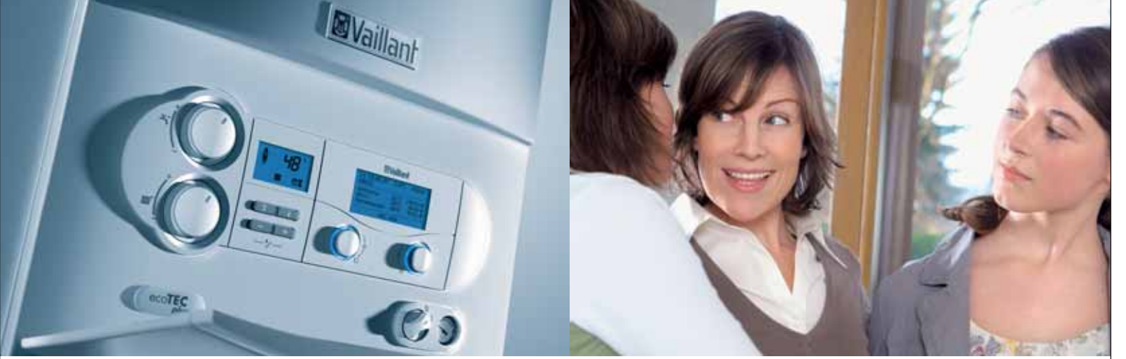
ecoTEC Plus VU Yoğuşmalı Duvar Tipi Isıtma Cihazı