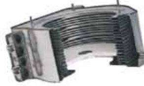
Paslanmaz Çelik Yoğuşmalı Isı Eşanjörü (VU 466)

ecoTEC plus VU yoğuşmalı duvar tipi ısıtma cihazları kapasitesini, ayarladığınız sıcaklığı karşılayacak şekilde kademesiz olarak ayarlar. %21 ile %100 arasında kademesiz alev modülasyonu (VU 656 için) yaparak cihazı boş yere çalıştırmaz ve konforlu bir ısıtma yaparken yakıt tasarrufu sağlar.