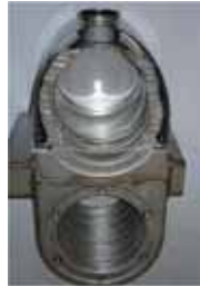
Paslanmaz Çelik Yoğuşmalı Isı Eşanjörü (VU 656)

ecoTEC plus VU cihazlar yoğuşma tekniğini kullanarak farklı ve verimli dizaynı, uzun ömürlü ısı eşanjörü ve mükemmel teknoloji ile %109'a varan yüksek bir kullanım verimine sahiptir. Geliştirilmiş oval ve farklı kesitlere sahip paslanmaz çelik yoğuşma eşanjörü; yoğuşma tekniği sırasında oluşan gerilmeleri dizaynından dolayı problemsiz bir şekilde yenerken, ses seviyesini de minimuma indirmiştir.